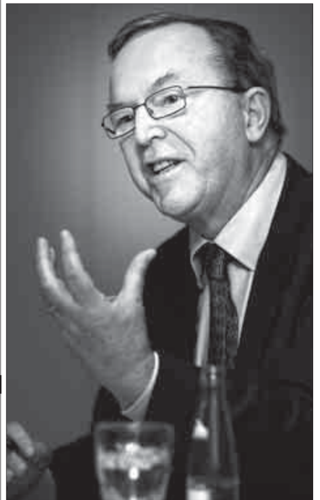
Wilfried Martens, premier 1979-1981, 1981-1992.

zeer voorwaardelijke onderhandelingen gaat en het best mogelijk is dat ze kunnen onderbroken worden of dat er helemaal geen toetreding komt. Vergeet niet dat president Jacques Chirac in de Franse grondwet heeft geschreven dat er een referendum over moet komen. Mijn probleem blijft het politieke Europa. Met Turkije erbij zie ik dat er niet snel komen. En dat was ons uitgangspunt. Daarom blijf ik voorstander van de associatieformule: het economisch Europa, met Turkije, kan eventueel groter kan zijn dan het politieke Europa.