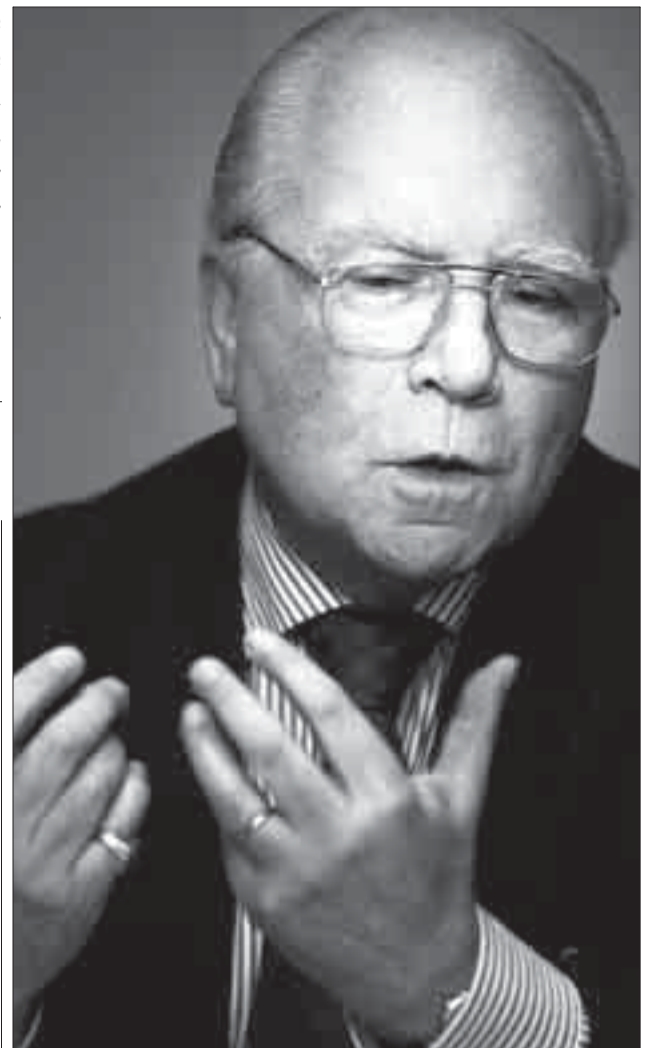
Mark Eyskens, premier 1981.

„Mijn probleem blijft het politieke Europa. Met Turkije erbij zie ik dat er niet snel komen. En dat was ons uitgangspunt.”