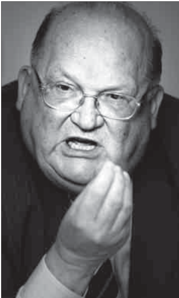
Jean-Luc Dehaene, premier 1992-1999.